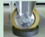
ストッパーゴム (別売り)